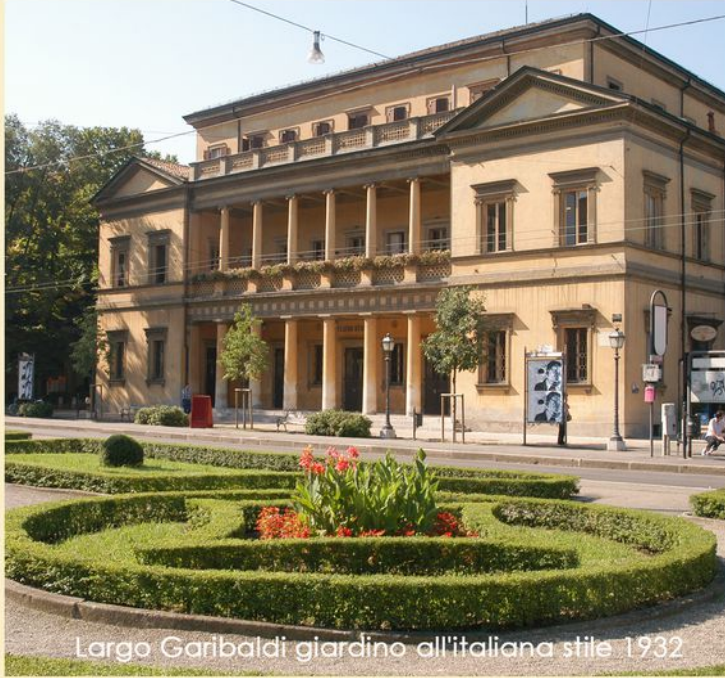
Largo Garibaldi giardino all'italiana stile 1932